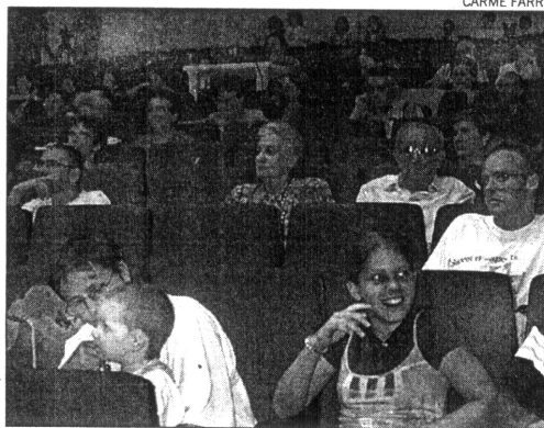
Un momento de la presentación del acto ayer.